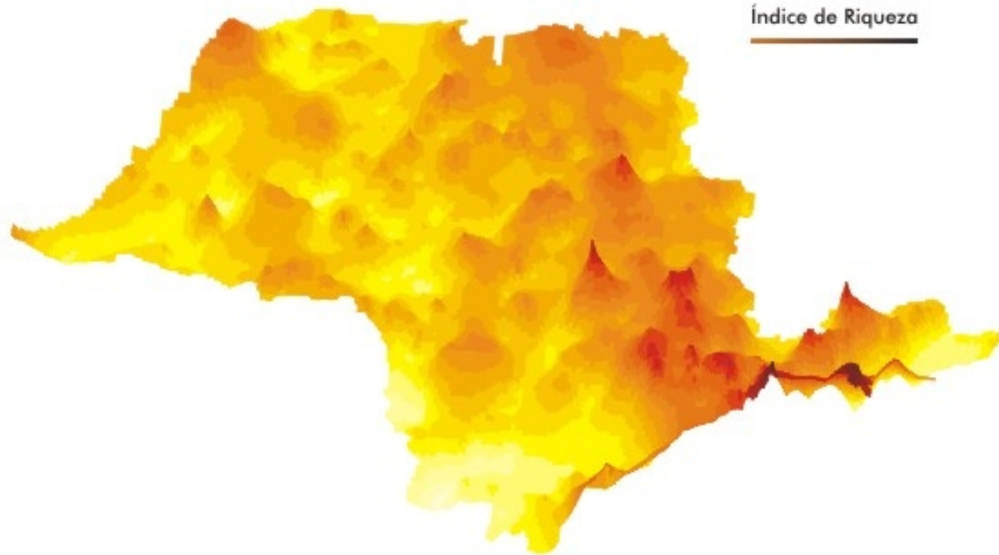
Índice de Riqueza